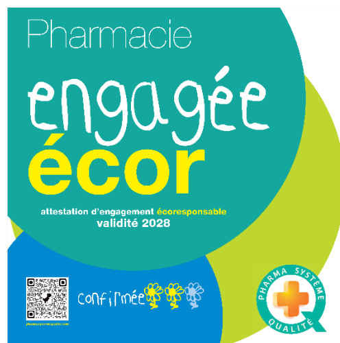
Vitrophane label ECOR® niveau confirmée

En février 2025 débutera la deuxième vague ECOR®.