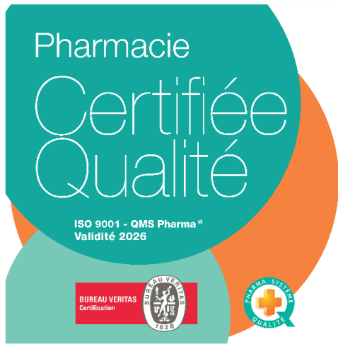
Vitrophanie Pharmacie certifiée Qualité ISO 9001-QMS Pharma®

Née à l'initiative de cinq groupements de pharmacies, Pharma Système Qualité (PHSQ) accompagne aujourd'hui 2750 officines engagées en certification ISO 9001-QMS Pharma®.